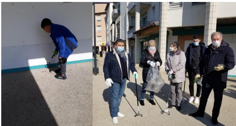
Enfants et élus participent activement à la collecte de déchets

Beaucoup de bénévoles, ce samedi 19 mars, sont venus ramasser des déchets aux Pradettes. Merci à tous ceux qui ont participé à cette deuxième édition de collecte de déchets : enfants, parents, habitants des Pradettes, de Saint-Simon et de Lardenne, responsables et élus de la Mairie de Toulouse, responsables et élus du Collectif des Pradettes, responsables de Toulouse Métropole... Chacun a accepté de donner un peu de son temps et de son énergie pour que notre quartier soit plus propre. Grâce à l'aide logistique de l'équipe technique de Toulouse Métropole qui a fourni pour l'occasion pinces et sacs et s'est chargée de leur enlèvement, nous avons ramassé 60kg de déchets tout venant et 600g de mégots, une source peu connue et non négligeable de pollution.