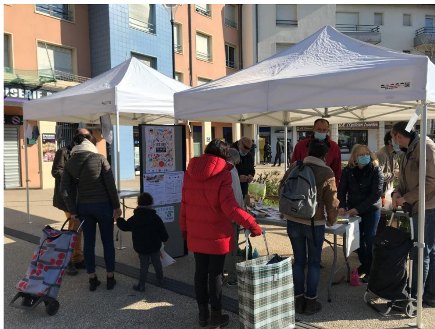
Samedi 20 mars Place des Pradettes

Le côté « ludique » ou « insolite » de l'opération « Plante ton slip » lancée par l'ADEME (Agence pour la transition écologique) a également été apprécié. Vous tomberez peut-être par hasard sur un petit écriteau signalant qu'un slip a été enterré à cet emplacement pour en vérifier la qualité du sol. N'y touchez pas et attendez que son propriétaire vienne le déterrer.